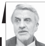
سیدمصطفی هاشمی طباطبائی